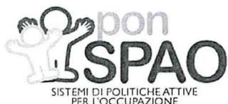
SISTEMI DI POLITICHE ATTIVE PER L'OCCUPAZIONE